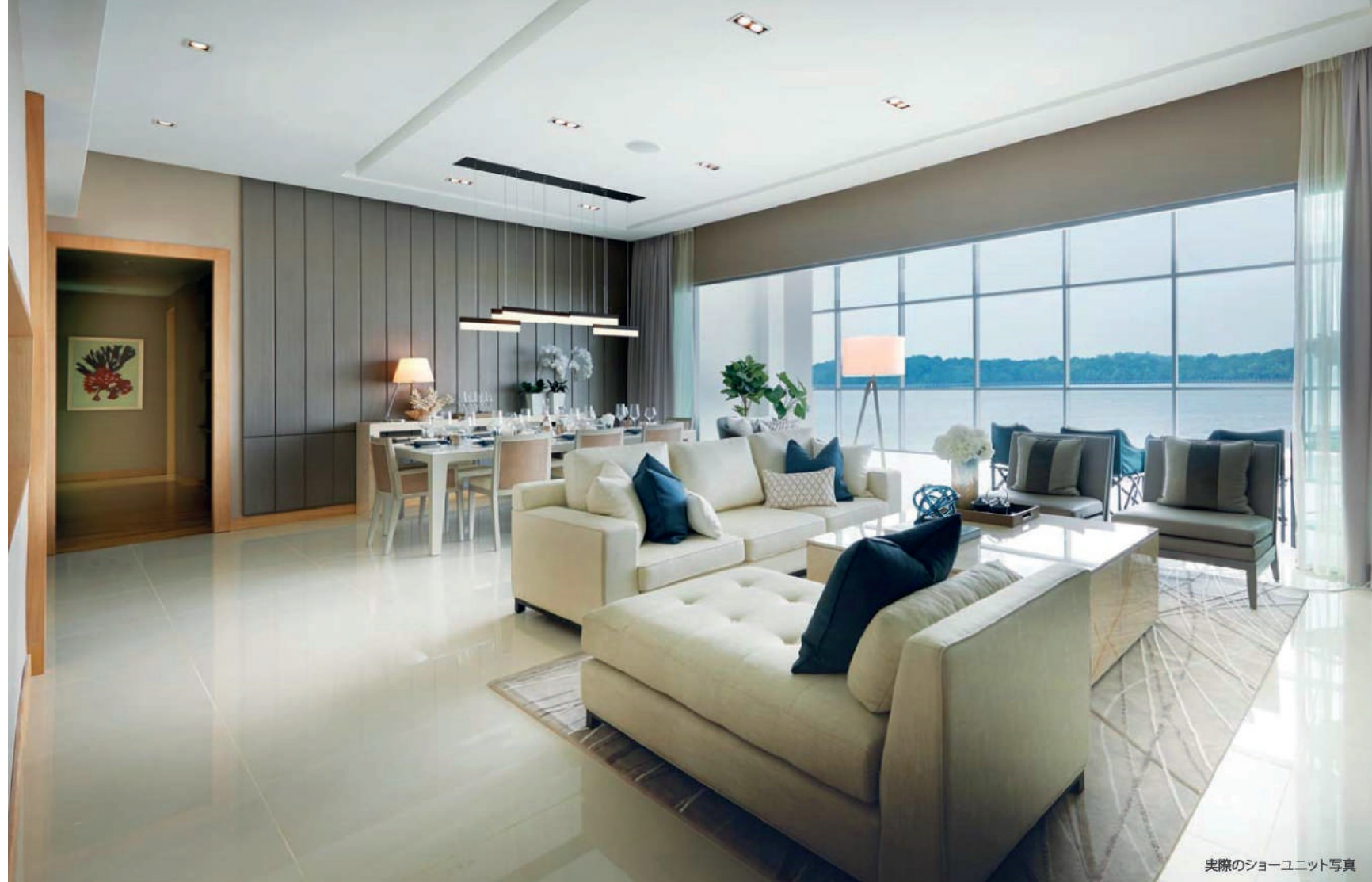
実際のショーユニット写真